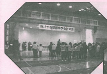
<ほ도가や地区センター> :本選の様相>