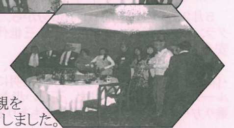
(岡部保土ヶ谷区長挨拶と両腕を組んでの合唱)