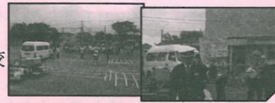
(紙ヒコーキ大会開催のご案内) 予選：6月27日(日)9:30～ 上菅田小学校体育館 本選：7月 4日(日)時間未定 保土ヶ谷スポーツセンター

当日は約200名の親子の参加があり、保土ヶ谷警察署・保土ヶ谷交通安全協会の方の説明により、正しい交通ルールを学びました。また、正しい歩き方や自転車の乗り方・車の特性(死角)実験等もありました。