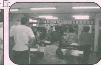
← いづれの写真も、ゆりちや会館での模様。